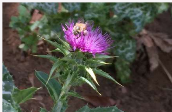
Flor Silybum marianum