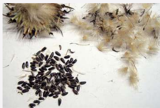
semillas Silybum marianum