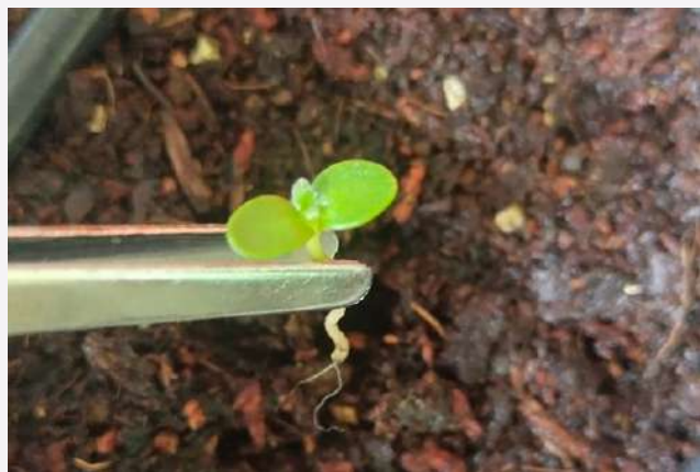
Pioneros en la región