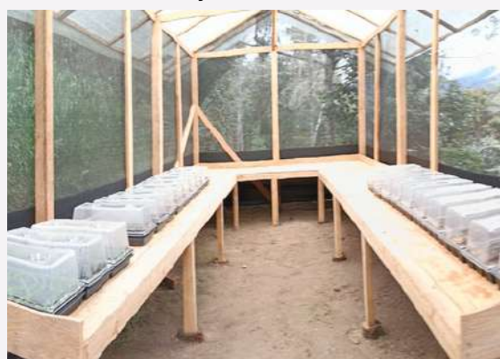
Viveros modelo Guamuez